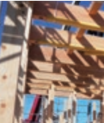
柱の柱、米松の梁、これぞ適材適所の骨太構造！