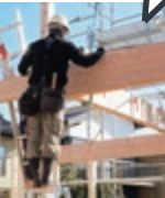
この梁がお家をしっかりと支え続けます！

昨年の中部地震で被災された方に心からお見舞い申し上げます。ウェリーハウスの現在の耐震基準は、性能表示制度で最高レベルの耐震等級3同等。一般的に木造の耐震施工基準として、地震の揺れに面(耐力壁)で抵抗する考え方が重視・注力される中、その基盤となる骨組み、いわゆる2階や屋根を支える梁(横材)やそれらを支える柱(縦材)の材質(樹種)や径(太さ)は重要視されない、または「違いがよくわからない」との理由で見落とされる方が多いと感じます。実はこの骨組みも最も重要な要素の一つで、設計段階で梁の組み方を一歩間違えると抜け落ちる！さらには径が細いあるいは、樹種が軟弱だと荷重に耐えられず1階の建具が開かなくなり経年劣化で建物にひずみが生じて耐震バランスが崩れるなど危険性も高まります。耐久性においても土台・柱にシロアリの大好物の樹種は禁物です。完成では見えなくなる構造又は仕様・設計の違いにより、この度の地震で明らかな差が出たのではないのでしょうか・・・骨組みも構造見学会で必ず一度はご確認されることをおすすめします！