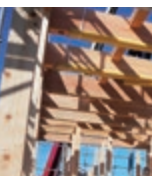
柱の柱、米松の梁、これぞ適材適所の骨太構造！