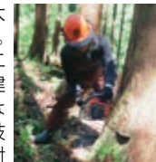
木材を知り尽くすための 林業体験！

当社では、建築工事の約70%を占める大工工事を社員で責任を持って行っています。高等技術を身につけた一級技能士2名、二級技能士1名、新入社員にも必ず3年間「建築高等職業訓練校」で技能を習得させるなど、人材育成にも力を入れております。技能士試験では、与えられた高度な課題に対し、限られた短い時間内に一から手作業で造り上げ、完成させたものだけが採点されます。つまり正確性とスピードがなければ合格できません。現場に例えると、一つ一つの工程に対して無駄に時間をかけるとコストが上がります(時間切れ)、早さを求めて手間を省くと正確性を欠いて欠陥工事となります(不合格)。大工工事と言っても技能のジャンルが幅広いですが、常に正確性とスピードが必要とされ、その基準こそが大工工事における『適正価格』と考えております。