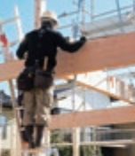
この梁がお家をしっかりと支え続けます！

昨年の中部地震で被災された方に心からお見舞い申し上げます。ウェリーハウスの現在の耐震基準は、性能表示制度で最高レベルの耐震等級3同等。一般的に木造の耐震施工基準として、地震の揺れに面(耐力壁)で抵抗する考え方が重視・注力される中、その基盤となる骨組み、いわゆる2階や屋根を支える梁(横材)やそれらを支える柱(縦材)の材質(樹種)や径(太さ)は重要視されない、または「違いがよくわからない」との理由で見落とされる方が多いと感じます。実はこの骨組みも最も重要な要素の一つで、設計段階で梁の組み方を一歩間違えると抜け落ちる！さらには径が細いあるいは、樹種が軟弱だと荷重に耐えられず1階の建具が開かなくなり経年劣化で建物にひずみが生じて耐震バランスが崩れるなど危険性も高まります。耐久性においても土台・柱にシロアリの大好物の樹種は禁物です。完成では見えなくなる構造又は仕様・設計の違いにより、この度の地震で明らかな差が出たのではないのでしょうか・・・骨組みも構造見学会で必ず一度はご確認されることをおすすめします！